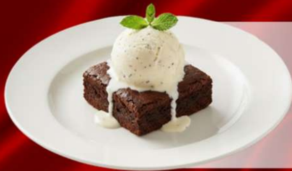
Bánh Sô Cô La và Kem Vanilla Brownie with Vanilla Ice Cream

Bột sô cô la, hạt điều, dâu tây, xoài, kem hương vanilla và sô cô la