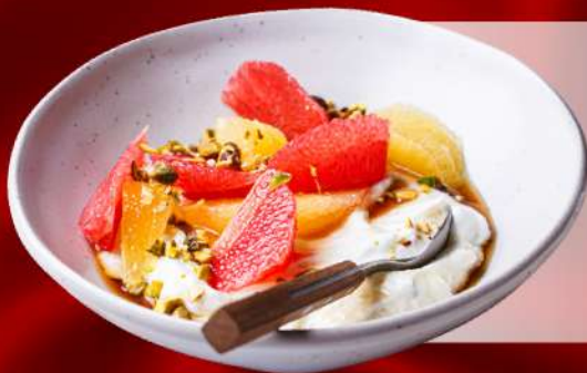
Trái Cây Tropical Fruit Platter

Trái cây, sữa chua Hy Lạp và hạt hướng dương Sliced tropical fruit, Greek yogurt, toasted sunflower seed