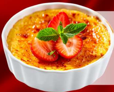
Bánh Kem Nướng Kiểu Catalan Crème Catalan